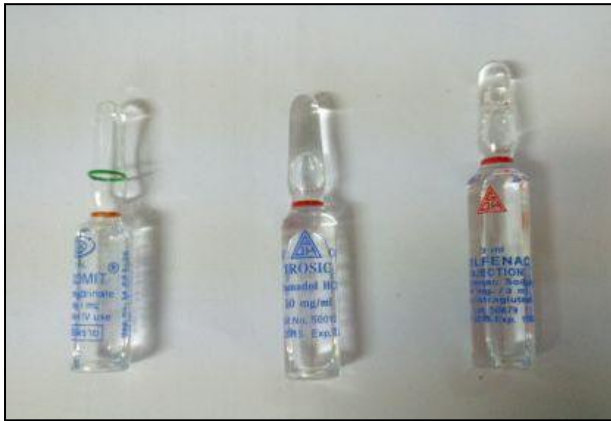
Dimenhydrinate inj. : Tramadol inj. : Diclofenac inj.