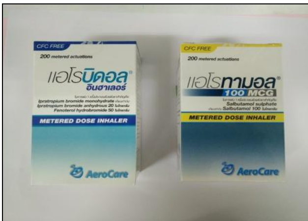
Berodual®MDI : Salbutamol®MDI