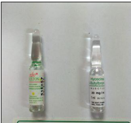
Dexamethasone 4 mg inj. : Buscopan® 10 mg inj.