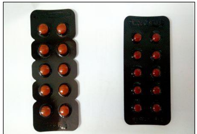
Hydralazine 10 mg : Hydroxyzine 10 mg