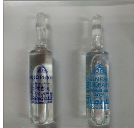
Aminophylline 250mg/10 ml inj. : 10%MgSO4 inj.