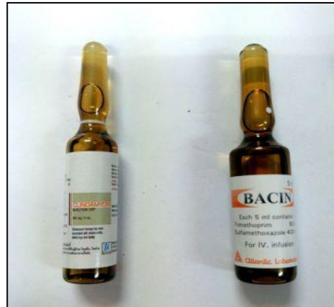
Bactrim®(80/400)inj. : Clindamycin 600 mg inj.