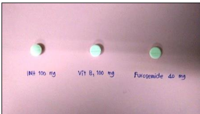
INH tab 100 mg : Vitamin B1 100 mg : Furosemide tab 40 mg