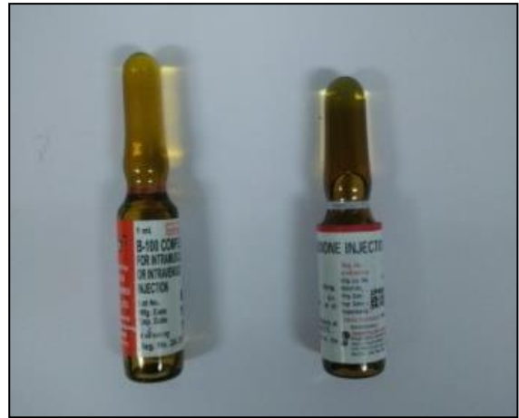
Vit. B complex inj. : VitaminK 10 mg inj.