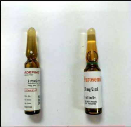
Nicardipine 2 mg inj. : Furosemide 20 mg inj.

รูปภาพแสดงคู่ยาที่มีลักษณะคล้ายกัน (Look Alike)